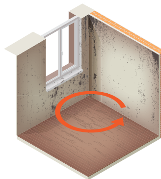
Maison sans ventilation performante